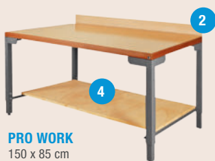
PRO WORK 150 x 85 cm