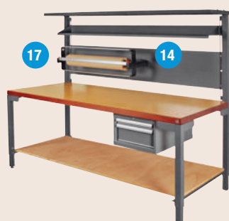
PRO PACK 200 x 85 cm