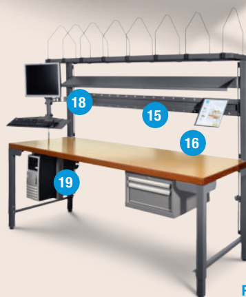
PRO INFORMATIQUE 200 x 85 cm